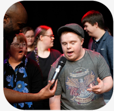
Bilder från firandet på Världskulturmuseet 2023.