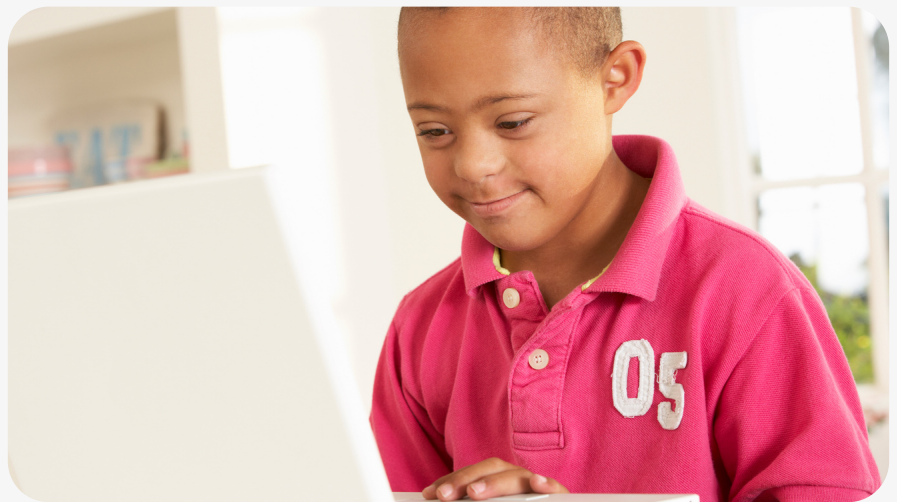
Illustrationsbild från bildbyrå