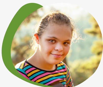
Illustrationsbild från bildbyrå.